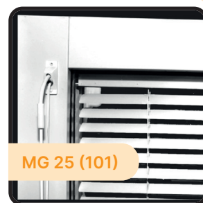
MG 25 (101)

Kan manövreras och regleras via en kulkedja.