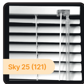
Sky 25 (121)

Monteras på fasta fönster. När nischdjupet är mer än 20 mm kapas överlisten 10 mm så att vridstången får plats.